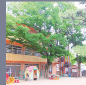
園庭の木は、冬は葉を落とし陽ざしを 届け、夏は繁り日陰をつくれます。

パズルのピースは、あっちが出っ張ったり、こっちが凹っこんだり。私たちにも凸凹があります。 自分の凹みは仲間に助けてもらいます。その分、ためらうことなく自分の出っ張りで仲間を助けます。助けられた仲間は心から感謝します。 そんな風に助け合えることが日吉の強みです。そうやって築いた人間関係があるから、「心地良いチーム」として成長していけると信じています。