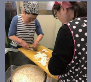
給食はベテラン職員の手作り。若い スタッフも巻き込み楽しく作っています。