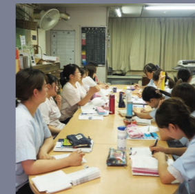
月3回職員が集まり会議をしています。 新人も臆することなく発言できる風土です。